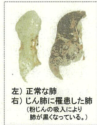
左) 正常な肺 右) じん肺に罹患した肺 (粉じんの吸入により肺が黒くなっている。)

現在、じん肺を治す根本的な治療がないため、じん肺にかからないための措置として、粉じんの発生源対策、局所排気装置等の適正な稼働、呼吸用保護具の適正な着用などにより、粉じんへの「ばく露防止対策」を徹底することが重要です。